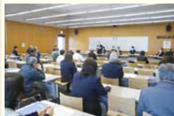
民生委員福祉協力員合同研修会