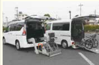
福祉車両貸出事業